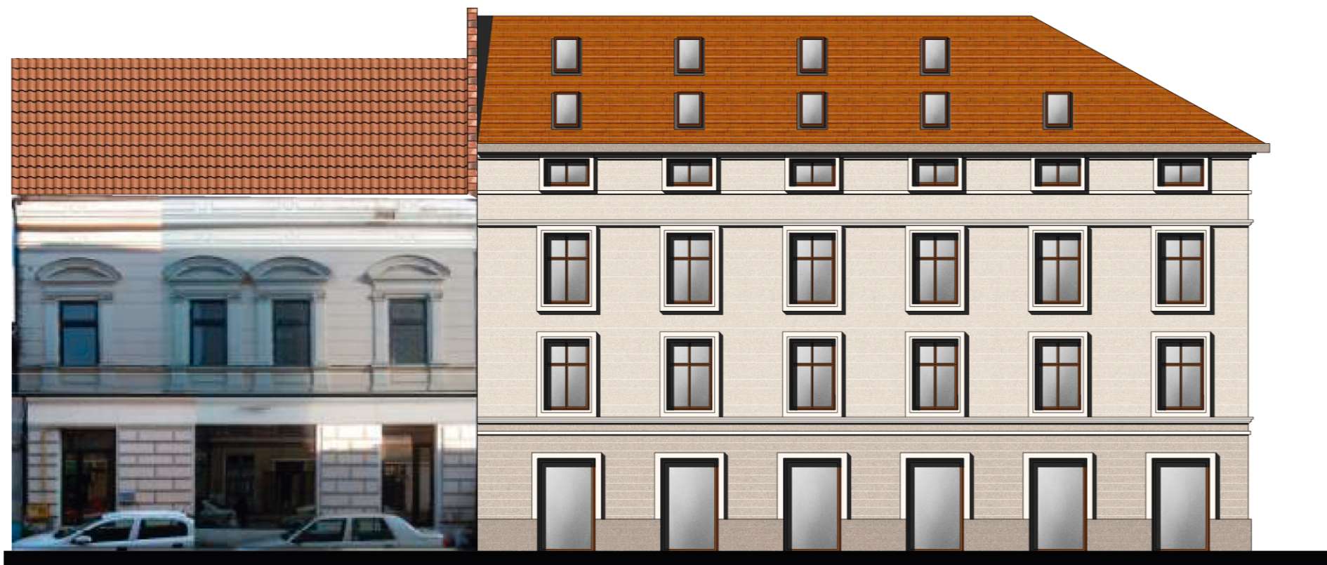
VARIANTA 1 - STR. E. UNGUREANU